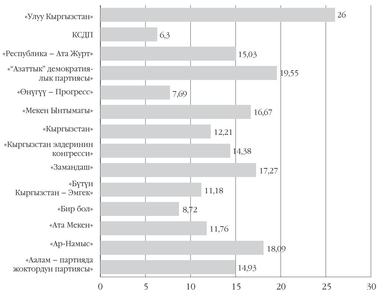
Диаграмма 2. Саясий партиялардын катталган жалпы талапкерлеринин ичинен 28 жашка чейинки жаш талапкерлеринин проценттик катышы

Көп партияларда 28 жашка чейинки талапкерлер тизменин аягына коюлган. Бул жаштар талапкерлердин зарыл санын толуктоо үчүн эле киргизилген деген ойду жаратат. Иликтөөнүн жүрүшүндө партиялардын жаштар канаттарынын лидерлеринин тизмеде алган катар номери талданды. Жалпысынан, 2015-жылдагы парламенттик шайлоого катышкан 14 партиянын төртөөндө жаштар канатынын лидери талапкер болуп катталган, бирок алар дагы тизменин аягына коюлган.